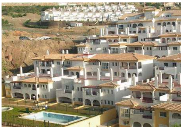
Residencial Los Nadales II | Benalmádena, Málaga