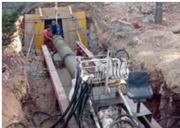
Saneamiento SP-1 | Benalmádena, Málaga