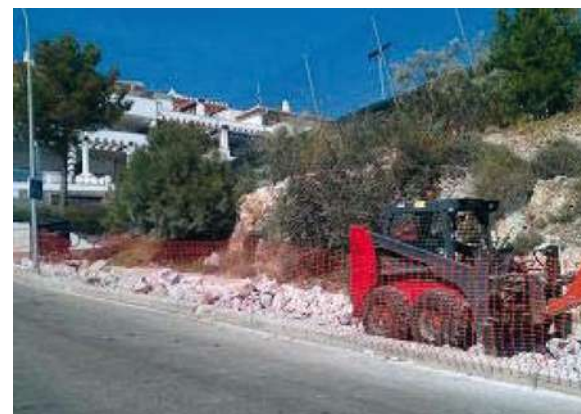
Cierre de anillo | Benalmádena, Málaga