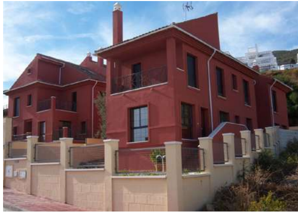
Residencial Los Nadales Villas | Benalmádena, Málaga