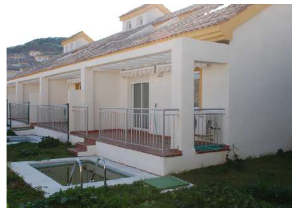
Villas La Viñuela II | Benalmádena, Málaga