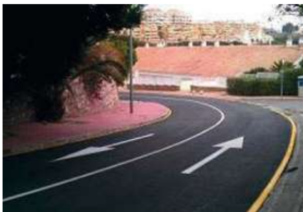
Reordenación Ronda del Golf | Benalmádena, Málaga