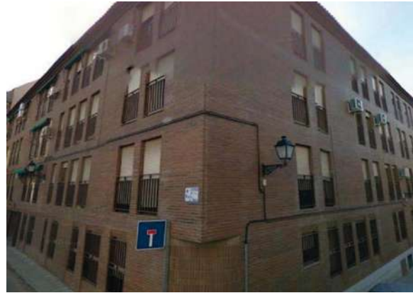
Edificio Avda. Plaza de Toros | Toledo