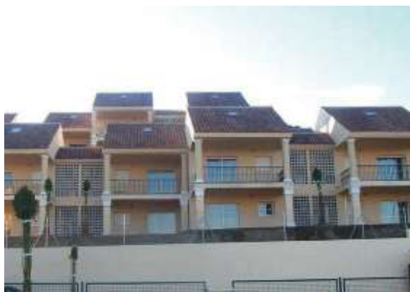
Apartamentos Pueblo Mediterráneo | Torremuelle, Benalmádena, Málaga