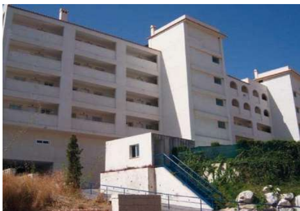
Residencial Golf Beach III | Nueva Torrequebrada, Benalmádena, Málaga