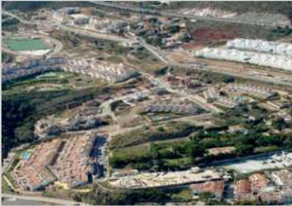
Sector SP-6A | Benalmádena, Málaga