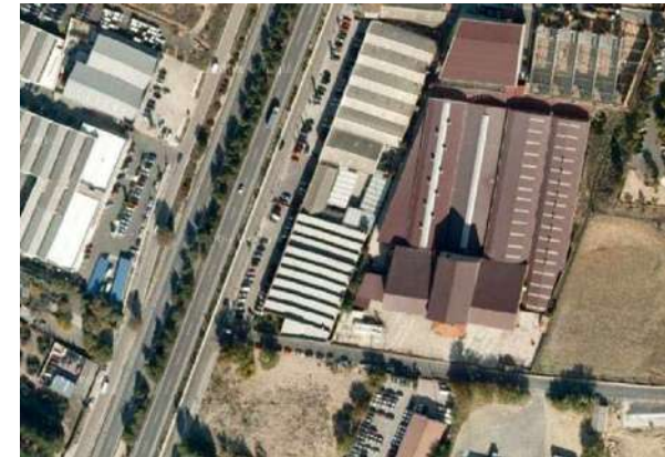
Naves industriales | Ctra. Madrid - Toledo