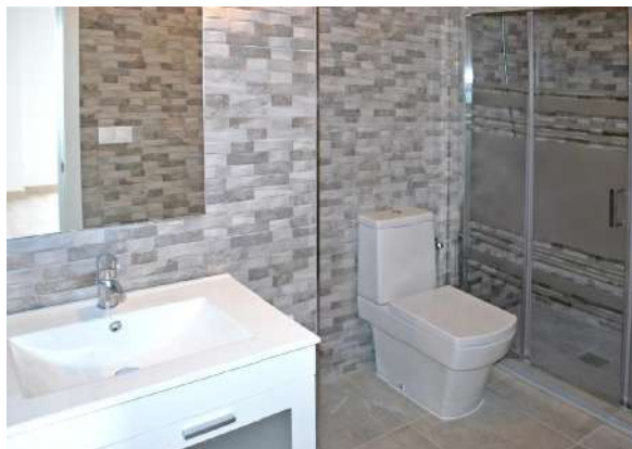
Benalroma | Benalmádena Costa, Málaga