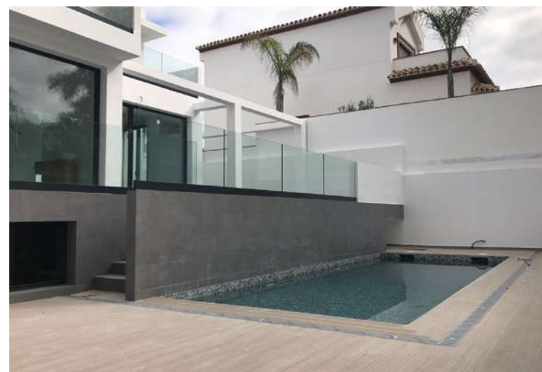
La Noria Golf | La Cala de Mijas, Málaga