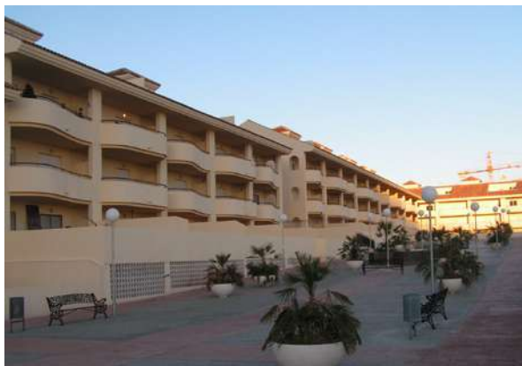
Residencial Panoramic | Arroyo de la Miel, Benalmádena, Málaga