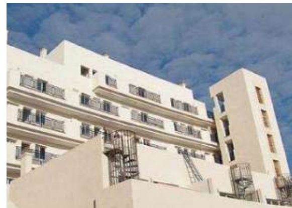
Residencial La Colina | Benalmádena, Málaga