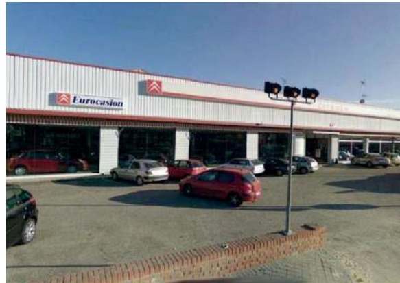
Naves industriales | Ctra. Madrid - Toledo