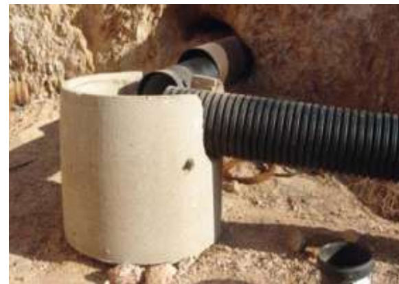
Saneamiento SP-1 | Benalmádena, Málaga