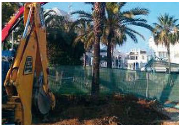
Jardinería Pto. Deportivo | Benalmádena, Málaga