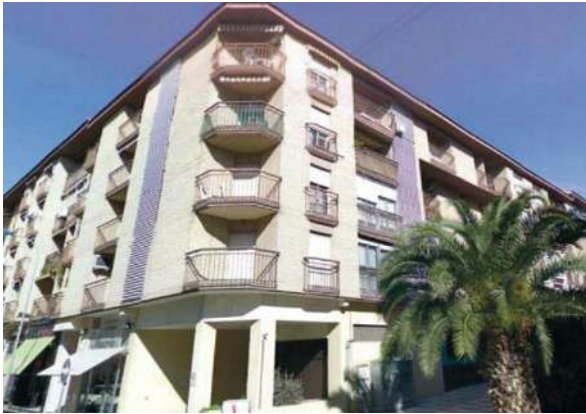
Edificios Barrio Sta. Teresa | Toledo