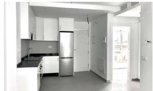
La Cala Beach | La Cala de Mijas, Málaga