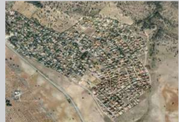
Las Nieves fase II | Nambroca, Toledo