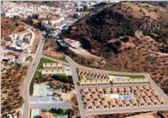
Sector SP-6A | Benalmádena, Málaga