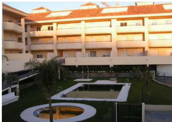
Residencial Panoramic | Benalmádena, Málaga