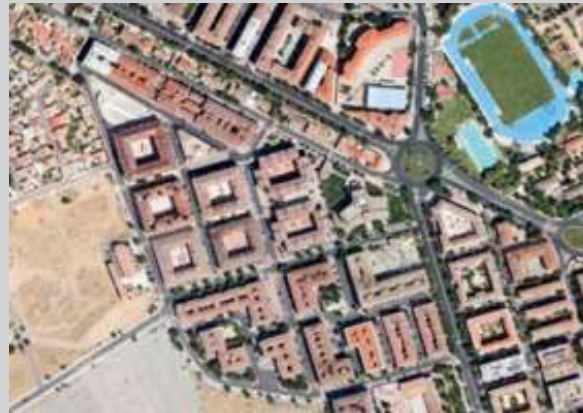
Barrio de Sta. Teresa | Toledo