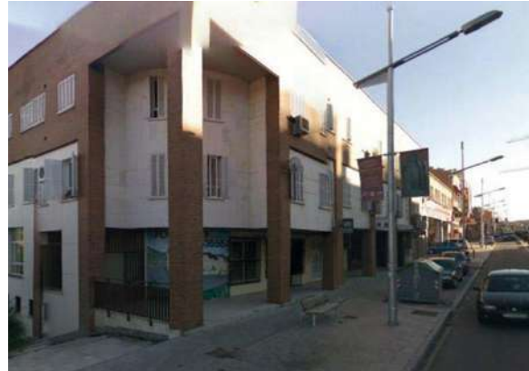
Edificio Avda. de Madrid | Toledo