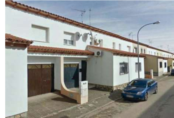
Adosados en Quintanar de la Orden | Toledo