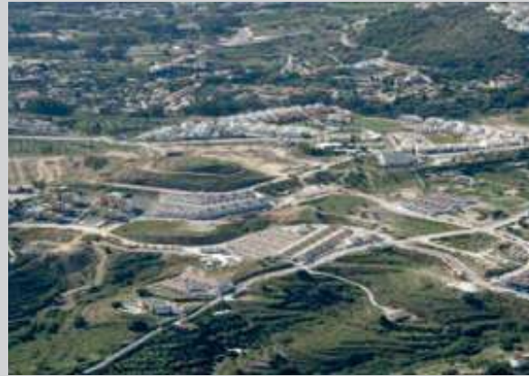
Sector SP-11 | Benalmádena, Málaga