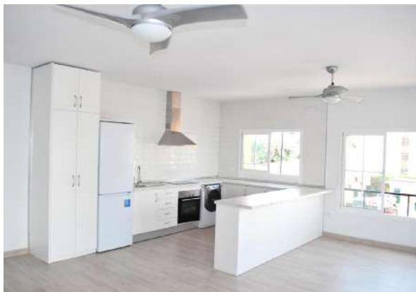
Benalroma | Benalmádena Costa, Málaga