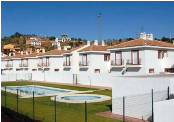
Residencial Rural Almogía | Almogía, Málaga