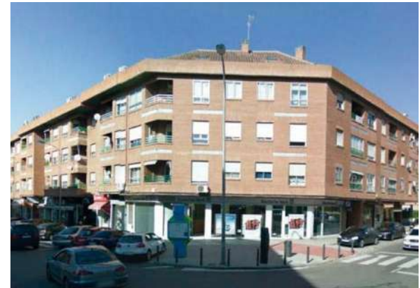
Edificios Barrio Sta. Teresa | Toledo