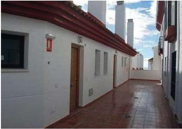
Apartamentos Pueblo II | Benalmádena, Málaga