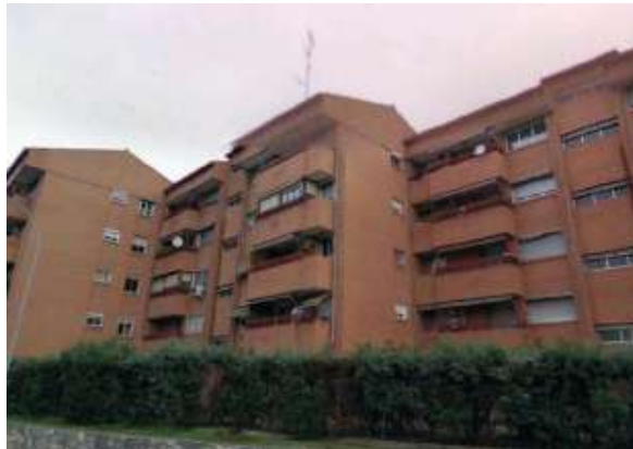
Edificio Avda. de Portugal | Toledo