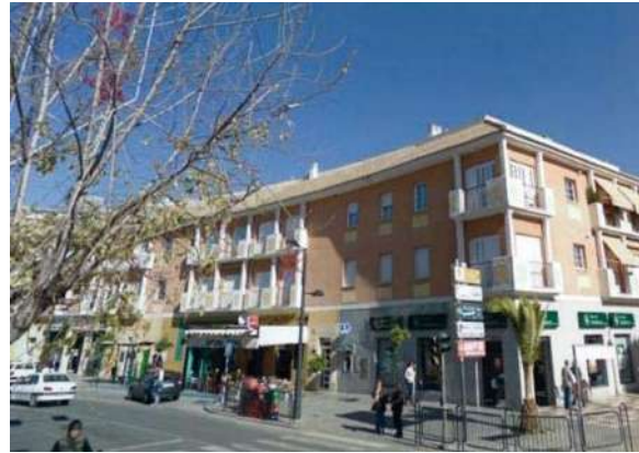
Edificio en Palma del Río | Córdoba