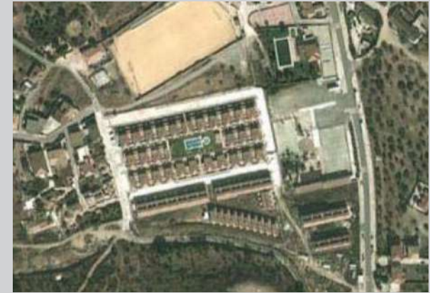
Sector UR-2 | Almogía, Málaga