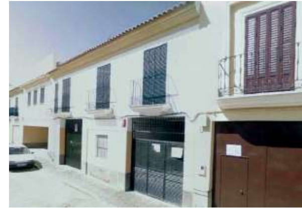
Edificio en el Arahál | Sevilla