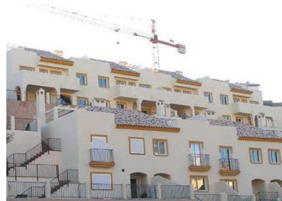
Residencial Torreblanca I | Fuengirola, Málaga