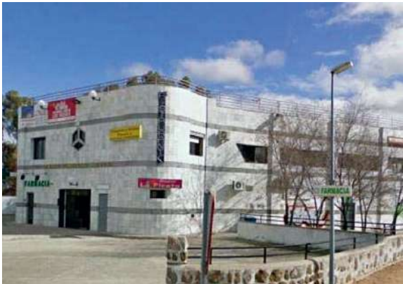
Edificio comercial Las Nieves | Nambroca, Toledo