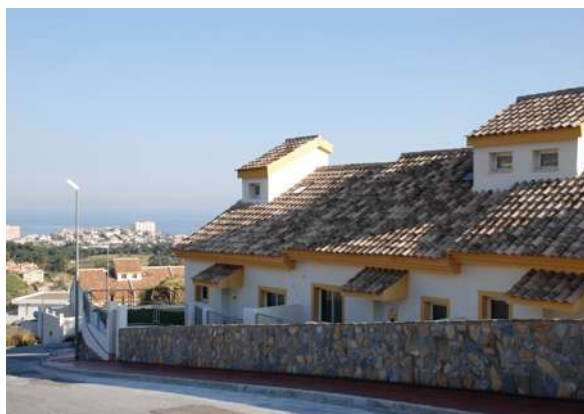
Villas adosadas La Viñuela | Benalmádena, Málaga