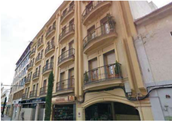
Edificio Arroyazo | Don Benito, Badajoz