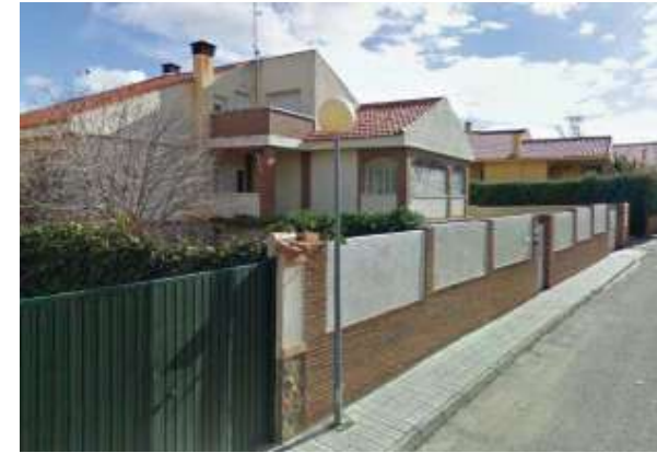
Complejo Las Nieves II | Nambroca, Toledo