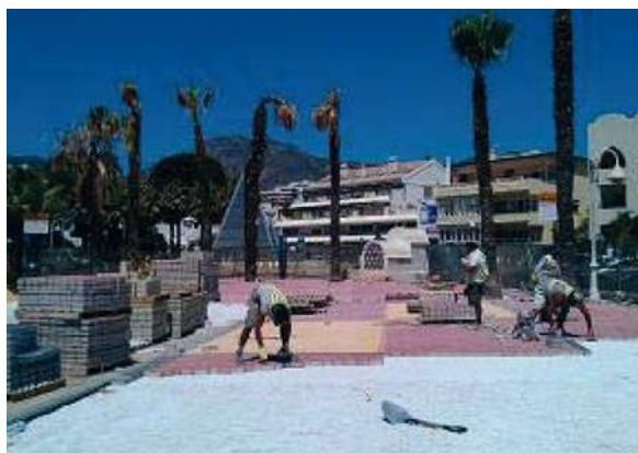
Pza. de las Velas | Benalmádena, Málaga