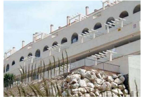
Edificio Eurogolf | Benalmádena Costa, Málaga