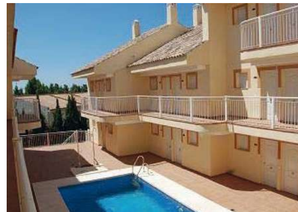
Hotel - Aptos. turísticos | Arroyo de la Miel, Benalmádena, Málaga